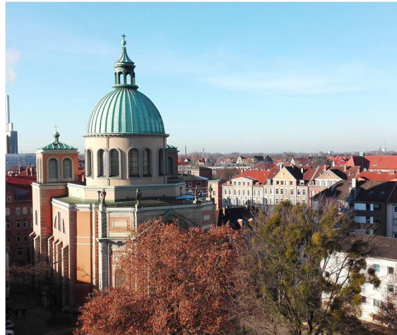
Die Basilika St. Clemens, römisch-katholische Hauptkirche der Region Hannover, ist der nördlichste Kirchenbau Europas im Stil des venezianischen Barock.